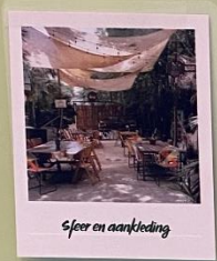
Sfeer en aankleding