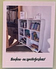
Boeken- en spelletjeskast