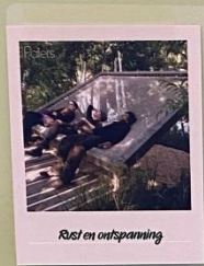
Rust en ontspanning