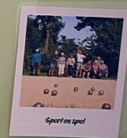
Sport en spel